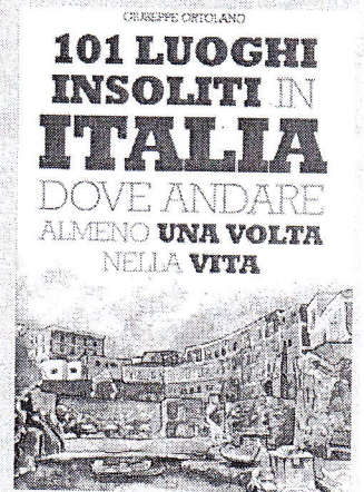
La copertina della guida

"C" è un'Italia schiva e riservata, che non ama il turismo di massa e che custodisce in silenzio i suoi tesori. È un'Italia meno nota, fatta di antiche casa contadine, castelli abitati da fantasmi, isole di sirene e gabbiani, foreste anticamente battute dai briganti, borghi medievali incastonati tra le montagne e semplici villaggi di pescatori. Destinazioni insolite, poco celebrate dalle tradizionali guide turistiche e tuttavia belle e suggestive; da scoprire con calma, in punta di piedi, assaporando colori e odori, sapori e silenzi, piazze e vicoli, panorami e opere d'arte". Questa Italia è raccontata dal giornalista Giuseppe Ortolano nella guida "101 luoghi insoliti in Italia - Dove andare almeno una volta nella vita". Ortolano, giornalista torinese, ha collaborato con numerose testate giornalistiche e attualmente cura le pagine "Appuntamenti della settimana - Cultura" e "Appuntamenti della