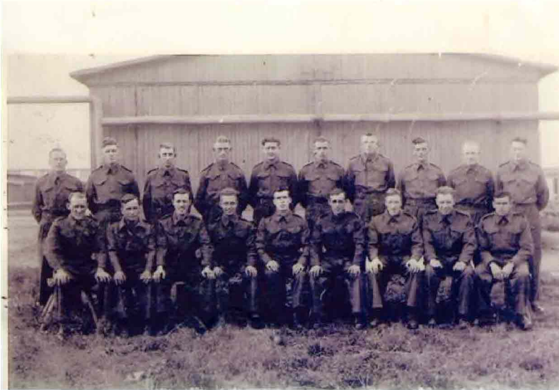
Monowitz - Auschwitz III - prigionieri inglesi

Articoli Interviste Eventi Recensioni Libri Recensioni Dischi - Artisti Recensioni Dischi - Compositori Recensioni DVD Café Letterario 1997-2006 Top News News spettacolo Video News