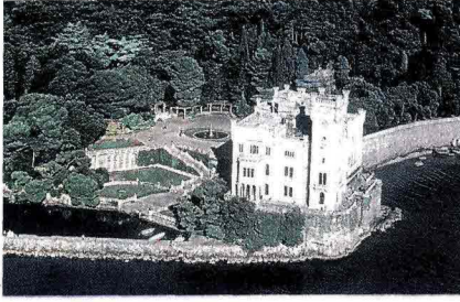
DA NORD A SUD In alto il Castello di Miramare a Trieste e a destra la Cappella Sansevero a Napoli