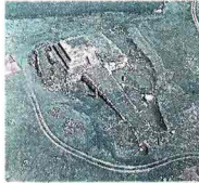
ALTARI E MAGIONI In alto il misterioso altare preistorico di Monte d'Accoddi in Sardegna e a sinistra il palazzo Ca' Dario a Venezia