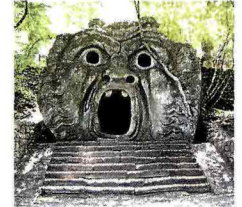
FACCE DI PIETRA Una delle ottanta stele della Lunigiana che risalgono a cinquemila anni fa. Sopra il più noto mostro di Bomarzo