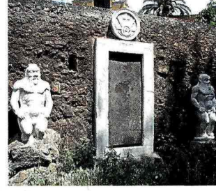
NELLA CAPITALE Oltre alla Porta Alchemica detta anche Porta Magica all'Esquilino, Roma è ricca di opere esoteriche dalla Piramide agli obelischi