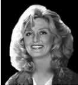
Lisa Jane Smith

L'autore. Lisa Jane Smith è americana e come dichiara lei stessa ha