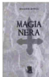
MARJORIE BOWEN Magia nera Gargoyle, 2011 pp. 312, euro 14,50