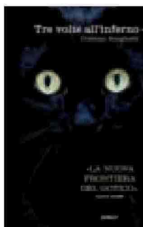
CHRISTIAN BORGHETTI Tre volte all'inferno Perdisa, 2011 pp. 350, euro 18,50