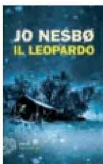
JO NESBO Il leopardo Einaudi, 2011 pp. 767, euro 21,00

Lotte e colpi di scena accompagneranno il lettore in un cammino seminato di malvagità e omicidi.