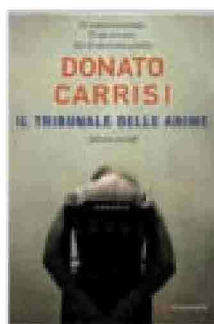
DONATO CARRISI Il tribunale delle anime Longanesi, 2011 pp. 462, euro 18,60