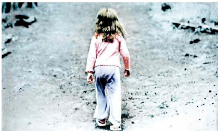
La colpa. Un particolare della copertina - Credits: Newton Compton

Tags: Il divoratore , La colpa , Lorenza Ghinelli , romanzo Lascia un commento