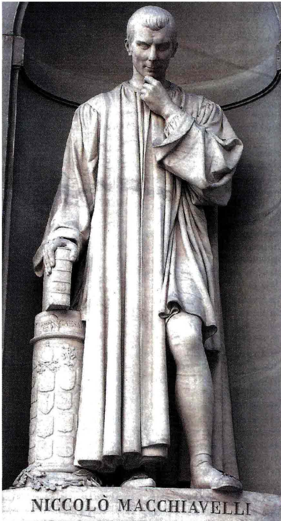
La statua di Niccolò Machiavelli alla Galleria degli Uffizi di Firenze