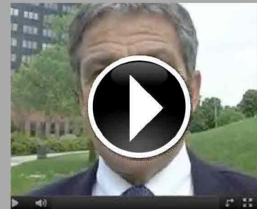
Ivo Rossi parla da neo Sindaco di Padova e del Ministro Flavio Z...